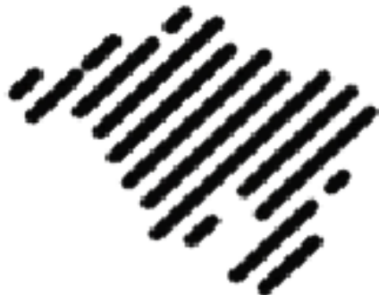
staré logo Moravskokrumlovsko

schůzi Moravskokrumlovsko jako jeho nové logo. Staré i nové logo přikládáme k porovnání a doufáme, že se to nové bude široké veřejnosti zamlouvat.